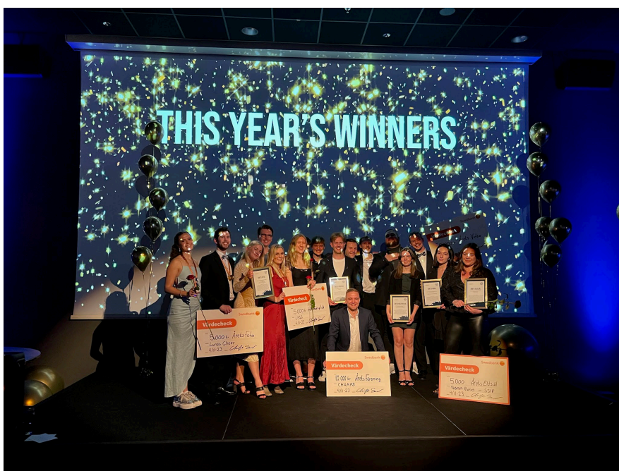
Mottagarna av årets utmärkelser får sina priser på Studentidrottsforum 2023

Motivering: Om du siktar högt måste idén som kommer att ta dig dit vara djärv, innovativ och fylld av osäkerhet. Årets vinnare tog ett tidigare obeprövat koncept och fyllde det med samarbeten, glädje och massor av den fantastiska envisheten bara drivna studenter besitter. Att hitta nya former, sätt och plattformar för att få fler elever att se skönheten i föreningen var det övergripande målet och förhoppningsvis kommer detta projekt att bli en hörnsten för föreningen i många år framöver.